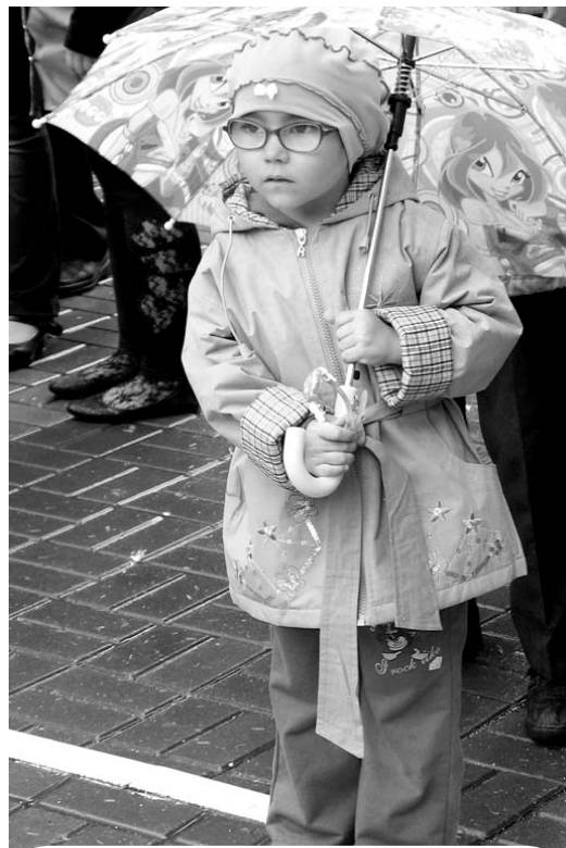
Надо запомнить!